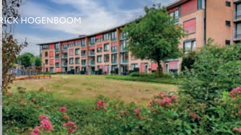
Eerste schetsen van de Posten (1964)